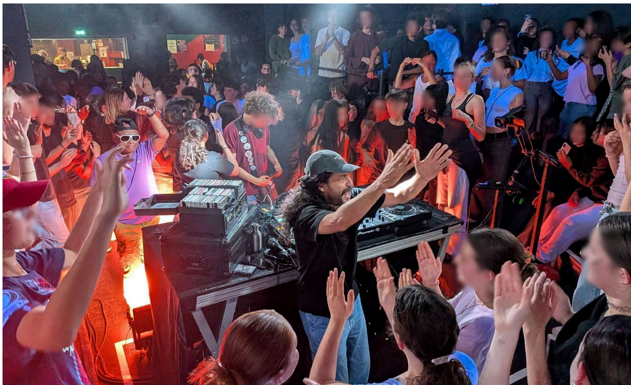
Les élèves de la chorale ont assisté à un spectacle de l'artiste Retro Cassetta le 12 mai dernier à l'UBU et ont dansé sur les musiques issues des cassettes qu'il collecte