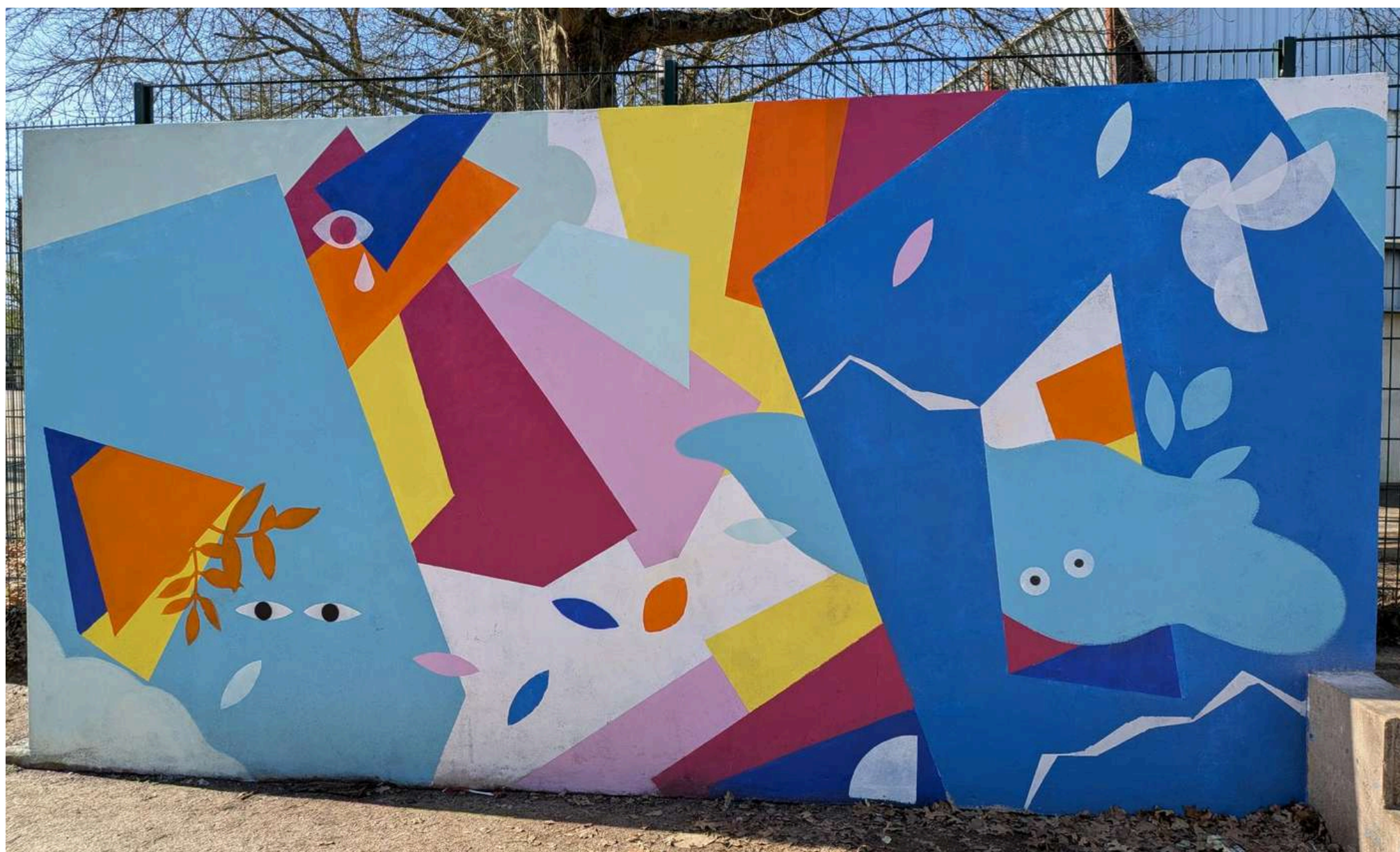
Les élèves de la classe de 3D ont participé à la réalisation d'une fresque sur un mur de la cour avec l'artiste Ariane Kensa sur le thème de la nature en ville